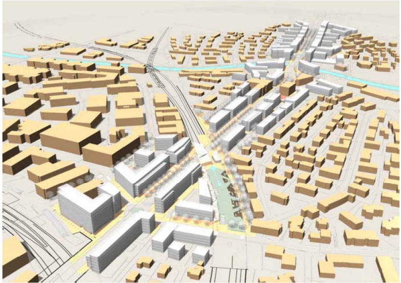
Sicht über das Zentrumsgebiet Schaffhauserstrasse von Süden her