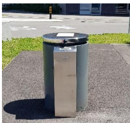
Einwurfsäule und Anleitung Presscontainer

WICHTIG: Bitte kein Styropor entsorgen , dieses verursacht Störungen. Abfall der einfach hingestellt wird, gilt Grundsätzlich als illegal entsorgt und kann entsprechend der Abfallverordnung geahndet werden.