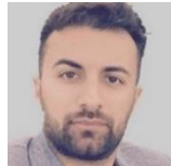
Pekerman Robin Haci SP